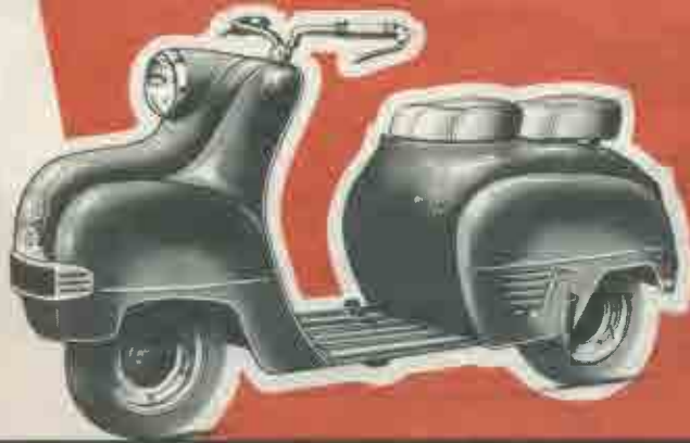
SCOOTER 125 cm 3 type S 25

SPÉCIFICATIONS : Moteur 125 cm 3 , 2 temps à piston étoilé, distribution à 2 transferts, culasse hémisphérique, en alliage léger, alésage 53,5, course 55. — Allumage et éclairage par volant magnétique. — Refroidissement par turbine à air canalisé et circulation forcée. — Carburateur : starter automatique, commande des gaz par poignée tournante. — Boîte : 2 vitesses, commandées par deux pédales, rapports de démultiplication : 1 re : 9,45 à 1, 2 me : 4,83 à 1. — Débrayage à disques multiples. — Freins : à tambour : AV, diam. 100, commande au guidon, AR, diam. 130 à commande au pied. — Roues : sur roulements annulaires indé réglables. — Pneus de 8x3,5. Changement rapide de la chambre à air par flasque amovible. — Suspension : AV, tube articulé sur biellettes et anneaux caoutchouc. — Siège AR., tube pivotant sur articulation du châssis et suspension par bloc caoutchouc comprimé, siège galbé Dunlopillo. — Divers : Réservoir essence 7 litres. — Coffre à outils amovible, sous le siège, permettant un accès facile du moteur. — Pare-chocs AR et AV. — Panneaux latéraux arrière amovibles. — Feu rouge catadioptrique. — Avertisseur électrique. — Vitesse : 70 kms h. — Consommation : 2 l. 5 aux 100 kms.